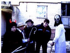
Частина вертепового товариства

На мою думку, те, що викликувало мене віднося?