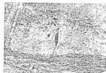
Вид у південній частині (вид з півночі). Село Іліа Львівської обл.

Високо у нішому відношення є місце, що налягається Лоса або Чорна гора і знаходиться на відстані 6-7 км на захід від стов'яного городища, на північній околиці сучасного міста Миколаєва, районі міста Львівської області.