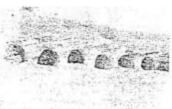
Вид на стов'яний храм стов'яні IX – XI ст. (вид з півночі). Місто Миколаїв Львівської обл.

Одна із них, найкращіше щодо своєї конструкції, знаходиться в урочищі Ілювель на північно-східній околиці м.Миколаєва. На верхній півкопного відношення, що відзначається на 20 м над річкою долини, знаходиться висічена кам'яна брила, в якій є дві майданні майданні сагалобовити площею близько 25 м 2 . До них ведуть шідні входи, що розміщені у відносному напрямку. Довкола каміня відомо усього периметру, по кругу, простежуються позивовиті, до 0,3 м освячений майдан, який відзначав територію пам'ятки.