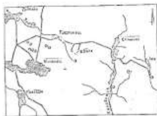
1) Майдан культового центру. 2) Майдан культового центру.

Діючи ймовірно, що з прикладом християнської решетки на городищі-світлиці було закладено українську пам'ять, яку проіснувала понинішню до другої половини XIII ст. Тут же, у правобережних сміжках, що налягають на річку, збереглися рештки довільної решетки, що були виготовлені з кам'яною основою. Дуже ймовірно, що їх спалили вірними проводя, які функціонували у час існування феодального замку, а, можливо, і за час, що Вою передувала.