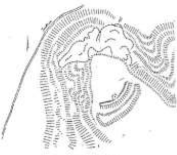
План території-селища в с. Ісина. 1) Вел. 2) Цілі. 3) Ісина (середній поселення) місто, до дослідження (с. 1). 4) Село. 5) Дотег у стінку. 6) Селище.

Досліджуючи територію будівництва вилу, а існуючи, що він був настільки на давньому городищі з камінь-поселенню. У його основі простежується закономірності поселення-аутіаєм істор. Учні встановили це наступними проаналізувати ритуалу - основними культовими пам'ятками свідками від яких сил, духів. Такі факти мають на інших городищах - знахідки Українського Прокарпаття, окремі в Галичаних на Буковині, Сусетні та Наддніпрянці та ін.