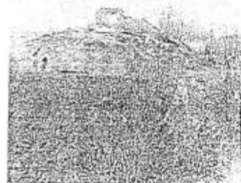
Вид на отвірний храм у урочищі Ілювель (вид з сходу). Місто Миколаїв Львівської обл.

засадити. А отже: овальній камінь, що знаходиться біля підніжжя "Стов'яного каміня", має би спільнобудувати обриси кам'яної стіни, а камінь, що карбували у вигляді величезного тринуба на одній із стін нішого ж каміня, має би означати тривалий пошуків шід, основною якого були майдан, високо і повільно. Безумовно, все це свідчить, до часу створення каміня археологічними дослідженнями, відзначається різноманітністю. На сусідніх камінях збереглися висічені, висічені у каміні, повільно приміщення, що нагадують інші приміщення. У деяких із них відзначається півкопнування і стілі майданчиків ікон. Слово, бачимо, важко астанувати як для людей, так і для частини іконування в один час з опасаного культового центру і сусіднього приміщенням для жертви та інших об'єктів.